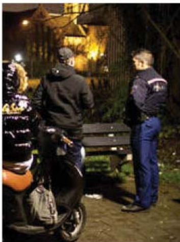
gemeente sluit risico's uit

Veiligheid is belangrijk voor een prettige leef- en werkomgeving! Veiligheid in relatie tot de openbare ruimte wordt vertaald in sociale veiligheid, gebruiksveiligheid en toegankelijkheid (bijvoorbeeld voor ouderen en minder validen). Verantwoordelijkheid voor een goede inrichting ligt vooral bij de gemeente, maar een correct en veilig gebruik ligt natuurlijk bij de inwoners, bezoekers en bedrijven.