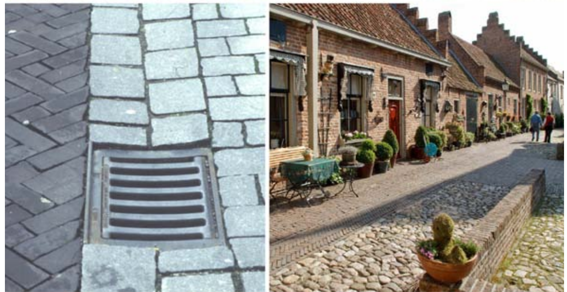
volgt de openbare ruimte